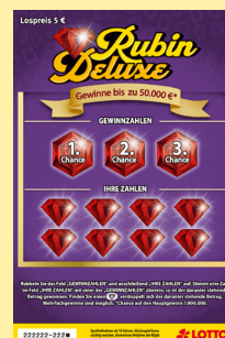
Lotterie 20-217: Abb. beispielhaft