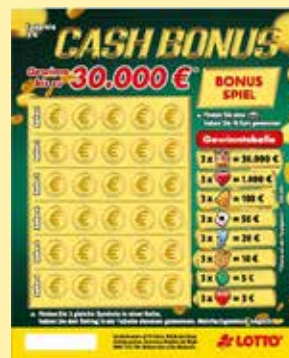
Lotterie 20-216: Abb. beispielhaft