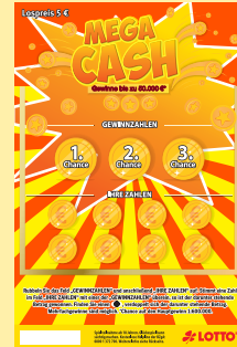
Lotterie 20-226 : Abb. beispielhaft